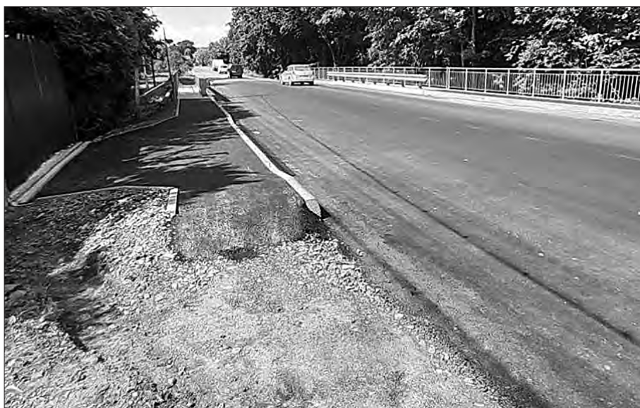
Міст у Верхньому Вербіжі.

хідність проводити відновлювальні роботи на мостових переходах, чим ми і займаємося». На дорогах державного значення області здійснюється цими днями й комплекс робіт із експлуатаційного утримання. Бригади асфальтують покриття локальними картами і