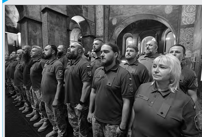
Більше фото тут — www.golos.com.ua

У стінах храму Святої Софії Премудрості Божої відбувся черговий випуск військових капеланів, які завершили курси підвищення кваліфікації з питань військового капеланства Збройних Сил України. Уперше в Україні, Військовий інститут Київського національного університету імені Тараса Шевченка підготував 60 офіцерів капеланської служби!