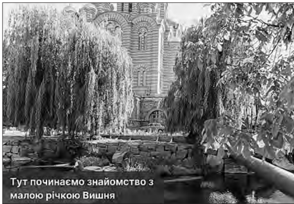
Тут починаємо знайомство з малою річкою Вишня

Віктор СКРИПНИК. Вінниця. Фото з фейсбук-сторінки «Малі річки Вінниці».